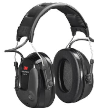
Nauszniki 3M™ PELTOR™ ProTac™ III Slim

1x Ochronniki słuchu 2x Baterie AA 1x Instrukcja obsługi