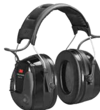
Nauszniki 3M™ PELTOR™ ProTac™ III

Ochrona słuchu z możliwością zewnętrznego podłączenia audio